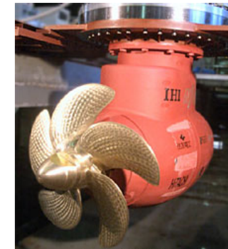
ポッド型推進装置 IHI