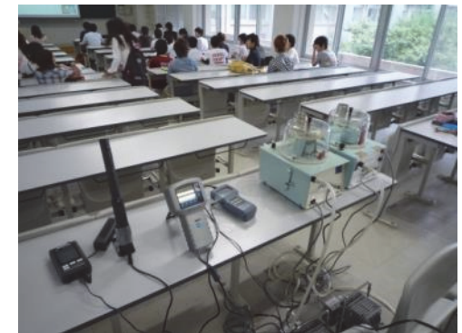
汚染物質濃度の測定