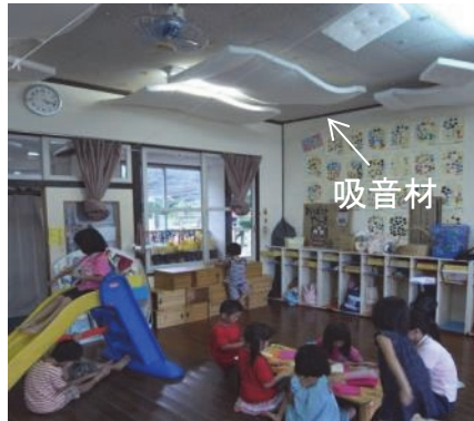
吸音効果の検証実験(保育室)