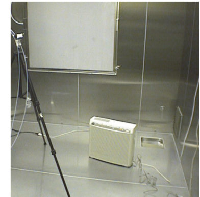
空気浄化性能の試験