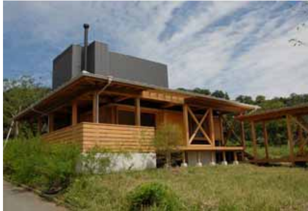
白水の家(2006年6月竣工)