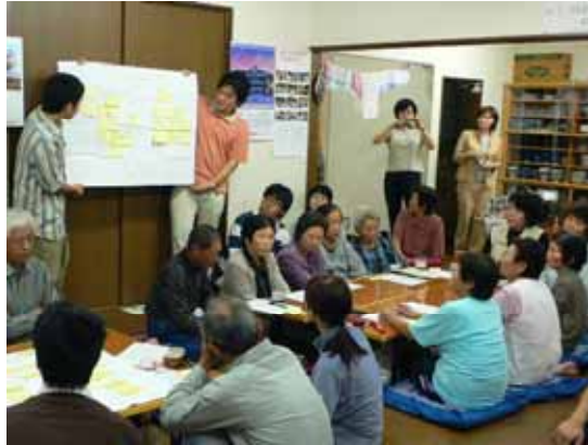
美里町の高齢者まちづくりワークショップ